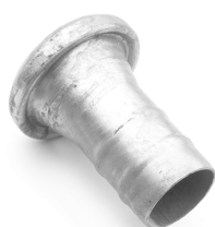
Raccordo femmina con portagomma