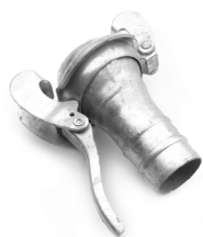
Raccordo maschio con portagomma