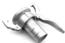
Femmina con portagomma