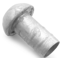
Maschio con portagomma