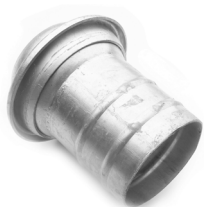
Maschio con portagomma