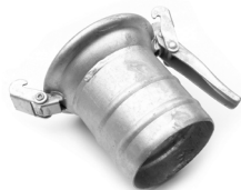
Femmina con portagomma