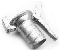
Femmina con portagomma