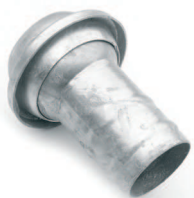
Maschio con portagomma