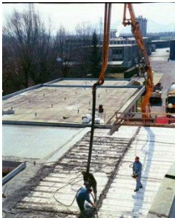
Endschlauch im Einsatz