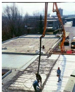
tubo terminale in applicazione