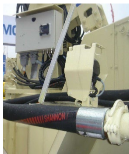
tubo di connessione in applicazione