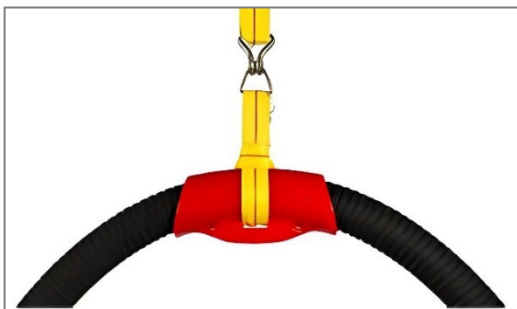
Sella du tuyau