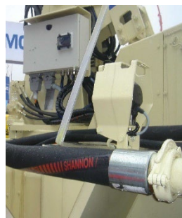
连接管组件应用现场