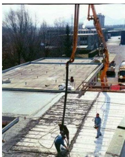
末端管组件应用现场