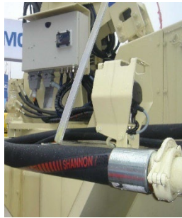
Longueur de connexion en application