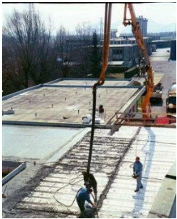
Longueur terminale en application