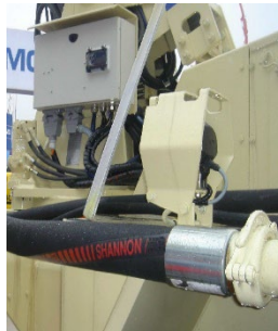
connection hose in use